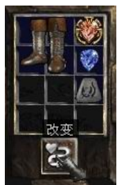
图示形状的鞋子+8号符文+完美蓝宝石+珠宝

+ (25-50) Defense vs. Missiles (+25-50)远程攻击防御) 5% Chance To Cast Level 4 Frost Nova When Struck (5%机会释放等级4霜之新星每次被击中) Attacker Takes Damage of (3-7) (伤害反弹(3-7))