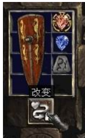
图示形状的盾牌+5号符文+完美蓝宝石+珠宝