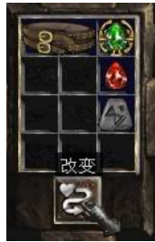
图示形状的腰带+7号符文+完美红宝石+珠宝

Crushing Blow (5-10)% (Crushing Blow的作用为按比例减少怪物的血量.详情请 点击这里 .) (1-3)% Life Stolen Per Hit (+ (1-3)%生命每次击中吸取) + (10-20) To Life (+ (10-20)生命点数)