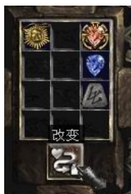
项链+10号符文+完美蓝宝石+珠宝

Hit Causes Monster To Flee [5-15] % (5-15%的机会使被击中的怪物逃跑) 5% Chance To Cast Level 8 Frost Nova When Struck (5%机会释放等级8霜之新星每次被击中) Attacker Takes Damage of (3-10) (伤害反弹(3-10))