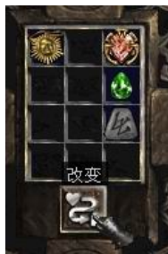
项链+10号符文+完美绿宝石+珠宝

+ (10-30)% Enhanced Defense (+ (10-30)% 增加防御力) Half Freeze Duration (冰冻时间减半) Magic Damage Reduced By (1-2) (法术伤害降低(1-2)) Damage Reduced By (1-4) 物理伤害降低(1-4)