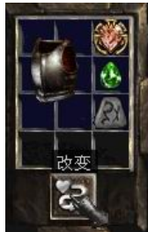
图示形状的盔甲+5号符文+完美绿宝石+珠宝

+ (10-30)% Enhanced Defense (+ (10-30)% 增加防御力) Magic Resistance +(5-10)% (防魔+(5-10)%) Magic Damage Reduced By (1-2) (法术伤害降低(1-2)) Damage Reduced By (1-4) (物理伤害降低(1-4))