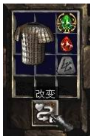
图示形状的盔甲+10号符文+完美红宝石+珠宝