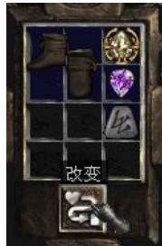
图示形状的鞋子+10号符文+完美紫宝石+珠宝

(1-4)% Mana Stolen Per Hit (+ (1-4)% 魔法值每次击中) Regenerate Mana (4-10)% (回复魔法值+(4-10)%) + (10-20) To Mana (+ (10-20) 点魔法值)