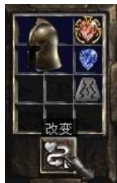
图示形状的头盔+6号符文+完美蓝宝石+珠宝

+ (25-50) Defense vs. Missiles (+25-50)远程攻击防御) 5% Chance To Cast Level 4 Frost Nova When Struck (5%机会释放等级4霜之新星每次被击中) Attacker Takes Damage of (3-7) (伤害反弹(3-7))