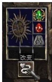
图示形状的盾牌+6号符文+完美红宝石+珠宝

Open Wounds (5-10)% ((5-10)%造成伤口) (1-3)% Life Stolen Per Hit (+ (1-3)%生命每次击中吸取) + (10-20) To Life (+ (10-20)生命点数)