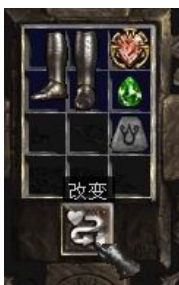
图示形状的鞋子+9号符文+完美绿宝石+珠宝