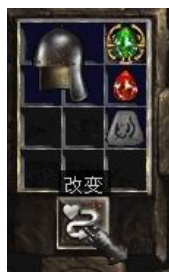
图示形状的头盔+8号符文+完美红宝石+珠宝