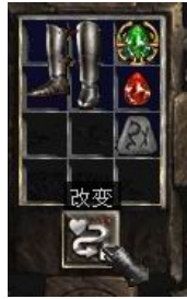
图示形状的鞋子+5号符文+完美红宝石+珠宝

Replenish Life + (5-10) (回复生命+(5-10)) (1-3)% Life Stolen Per Hit (+ (1-3)%生命每次击中吸取) + (10-20) To Life (+ (10-20)生命点数)