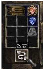
图示形状的腰带+7号符文+完美蓝宝石+珠宝