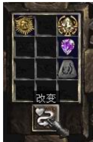
项链+8号符文+完美紫宝石+珠宝

+ (1-3) Mana Per Kill (+1-3)点法力每杀一个敌人) Regenerate Mana (4-10)% (回复魔法值+(4-10)%) + (10-20) To Mana (+10-20)点魔法值)