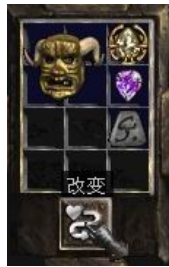
图示形状的头盔+4号符文+完美紫宝石+珠宝

(1-4)% Mana Stolen Per Hit (+ (1-4)% 魔法值每次击中) Regenerate Mana (4-10)% (回复魔法值+(4-10)%) + (10-20) To Mana (+ (10-20) 点魔法值)