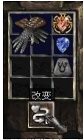
图示形状的手套+9号符文+完美蓝宝石+珠宝