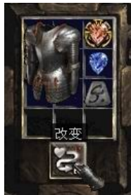
图示形状的盔甲+4号符文+完美蓝宝石+珠宝