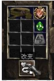
图示形状的腰带+7号符文+完美绿宝石+珠宝

+ (10-30)% Enhanced Defense (+ (10-30)% 增加防御力) Poison Resist +(5-10)% (防毒+(5-10)%) Magic Damage Reduced By (1-2) (法术伤害降低(1-2)) Damage Reduced By (1-4) (物理伤害降低(1-4))