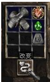
图示形状的手套+8号符文+完美绿宝石+珠宝