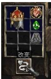
图示形状的头盔+6号符文+完美绿宝石+珠宝