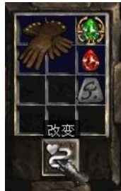
图示形状的手套+4号符文+完美红宝石+珠宝

Replenish Life + (5-10) (回复生命+(5-10)) (1-3)% Life Stolen Per Hit (+ (1-3)%生命每次击中吸取) + (10-20) To Life (+ (10-20)生命点数)