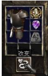
图示形状的盔甲+7号符文+完美紫宝石+珠宝

+ (5-10)% Increased Chance Of Blocking (+5-10)% 档格率) Regenerate Mana (4-10)% (回复魔法值+(4-10)%) + (10-20) To Mana (+10-20)点魔法值)