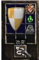
图示形状的盾牌+4号符文+完美绿宝石+珠宝

+ (10-30)% Enhanced Defense (+ (10-30)% 增加防御力) Poison Resist +(5-10)% (防毒+(5-10)%) Magic Damage Reduced By (1-2) (法术伤害降低(1-2)) Damage Reduced By (1-4) (物理伤害降低(1-4))