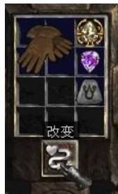
图示形状的手套+9号符文+完美紫宝石+珠宝

Increase Maximum Mana (2-5)% (增加(2-5)%法力上限) Regenerate Mana (4-10)% (回复魔法值+(4-10)%) + (10-20) To Mana (+ (10-20) 点魔法值)