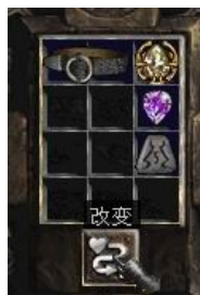
图示形状的腰带+6号符文+完美紫宝石+珠宝

+ (1-3) Mana Per Kill (+ (1-3) 点法力每杀一个敌人) Regenerate Mana (4-10)% (回复魔法值+(4-10)%) + (10-20) To Mana (+ (10-20) 点魔法值)