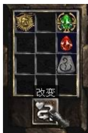
项链+11号符文+完美红宝石+珠宝