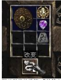
图示形状的盾牌+5号符文+完美紫宝石+珠宝

+ (5-10)% Increased Chance Of Blocking (+5-10)% 档格率) Regenerate Mana (4-10)% (回复魔法值+(4-10)%) + (10-20) To Mana (+10-20)点魔法值)